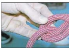
Kleiner Knoten, große Wirkung: Der Sicherungsknoten heißt „Doppelt gesteckte Acht“. Er hält auch, wenn der Kletterer abstürzt.

... man den Hochseilklettergarten erst nutzen darf, wenn man mindestens zwölf Jahre alt und über 1,40 Meter groß ist?